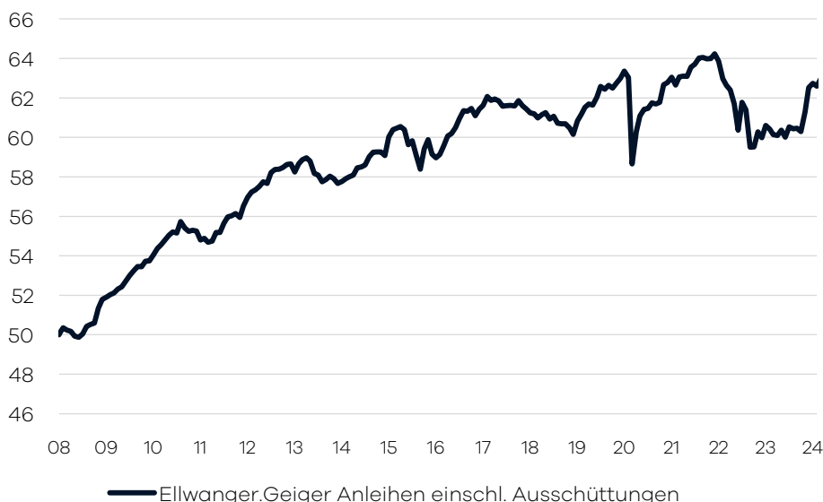
Bruttowertentwicklung 1 seit Auflage

der europäischen Kernländer einen Schwerpunkt. Bei der Auswahl der Unternehmensanleihen legen wir großen Wert auf gute Bonität der Emittenten. Zur Abdeckung der außereuropäischen Märkte und Spezialthemen wird vorwiegend in Investmentfonds (aktiv und passiv gemanagte Fonds) investiert. Die Auswahl dieser Drittfonds erfolgt auf Basis eines unabhängigen, quantitativen und qualitativen Screenings. Durch die breite Diversifikation (Streuung) über die verschiedenen Anlagemärkte und Laufzeiten hinweg wird das Risiko der Gesamtanlage gemindert. Unter Risiko verstehen wir, neben den allgemeinen Risiken und den speziellen Risiken von Anlagen in Fonds und Anleihen, auch die Häufigkeit und Intensität der Preisschwankungen im Wert des Fonds (Volatilität).