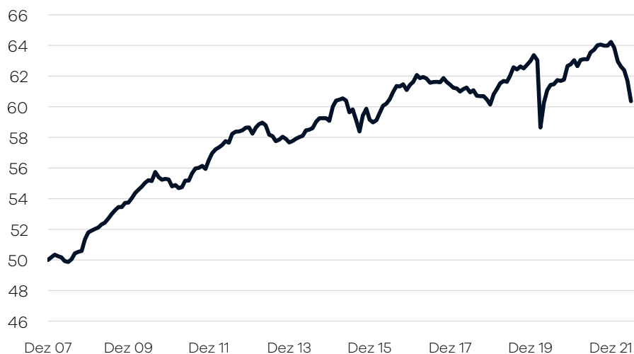
Bruttowertentwicklung 1 seit Auflage

— Ellwanger.Geiger Anleihen einschl. Ausschüttungen