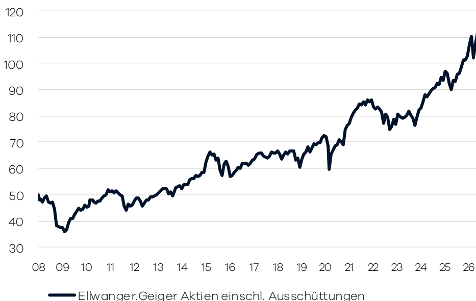
Bruttowertentwicklung 1 seit Auflage

Die internationale Aufteilung im Fonds wird durch die volkswirtschaftliche Analyse der Bankhaus Ellwanger & Geiger AG festgelegt. Passiv gemanagte Fonds (ETFs) über verschiedene Indizes hinweg bilden das Grundgerüst der Portfolio-Allokation. Ergänzend wird in aktiv gemanagte Aktienfonds investiert, welche bestimmte Länder/Regionen oder Themen/Branchen abdecken. Die Auswahl dieser Drittfonds erfolgt auf Basis eines unabhängigen, quantitativen und qualitativen Screenings. Der Fonds eignet sich für Aktienanleger mit einem langfristigen Anlagehorizont von mindestens 10 Jahren.