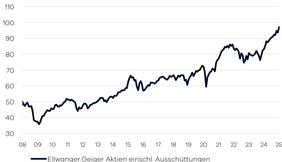
Bruttowertentwicklung 1 seit Auflage

Die internationale Aufteilung im Fonds wird durch die volkswirtschaftliche Analyse der Bankhaus Ellwanger & Geiger AG festgelegt. Passiv gemanagte Fonds (ETFs) über verschiedene Indizes hinweg bilden das Grundgerüst der Portfolio-Allokation. Ergänzend wird in aktiv gemanagte Aktienfonds investiert, welche bestimmte Länder/Regionen oder Themen/Branchen abdecken. Die Auswahl dieser Drittfonds erfolgt auf Basis eines unabhängigen, quantitativen und qualitativen Screenings. Der Fonds eignet sich für Aktienanleger mit einem langfristigen Anlagehorizont von mindestens 10 Jahren.