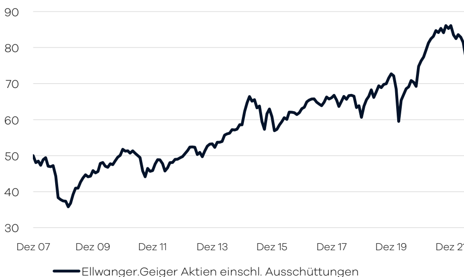
Bruttowertentwicklung 1 seit Auflage

Die internationale Aufteilung im Fonds wird durch die volkswirtschaftliche Analyse der Bankhaus Ellwanger & Geiger AG festgelegt. Passiv gemanagte Fonds (ETFs) über verschiedene Indizes hinweg bilden das Grundgerüst der Portfolio-Allokation. Ergänzend wird in aktiv gemanagte Aktienfonds investiert, welche bestimmte Länder/Regionen oder Themen/Branchen abdecken. Die Auswahl dieser Drittfonds erfolgt auf Basis eines unabhängigen, quantitativen und qualitativen Screenings. Der Fonds eignet sich für Aktienanleger mit einem langfristigen Anlagehorizont von mindestens 10 Jahren.