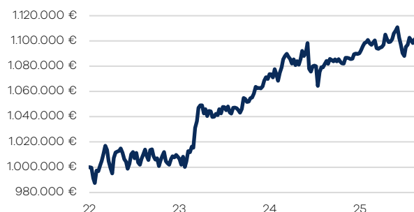
einer Investition von 1.000.000 Euro am 30.09.2022