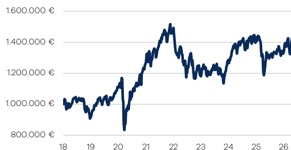
einer Investition von 1.000.000 Euro am 01.01.2018