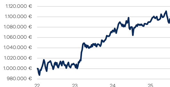
einer Investition von 1.000.000 Euro am 30.09.2022