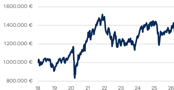
einer Investition von 1.000.000 Euro am 01.01.2018