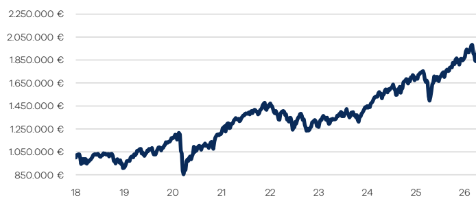
einer Investition von 1.000.000 Euro am 01.01.2018