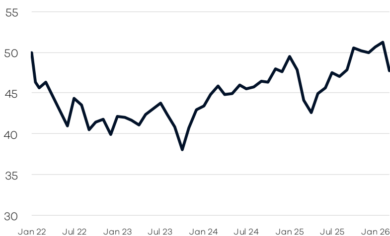
Bruttowertentwicklung 1 seit Auflage

— Ellwanger.Geiger Megatrends A einschl. Ausschüttungen