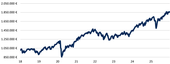
einer Investition von 1.000.000 Euro am 01.01.2018