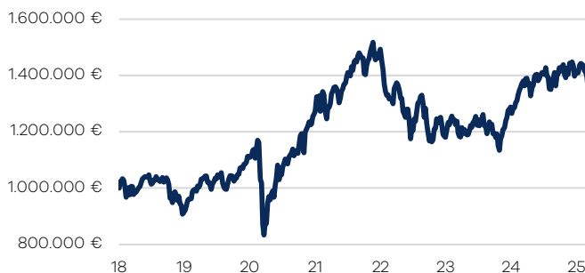
einer Investition von 1.000.000 Euro am 01.01.2018