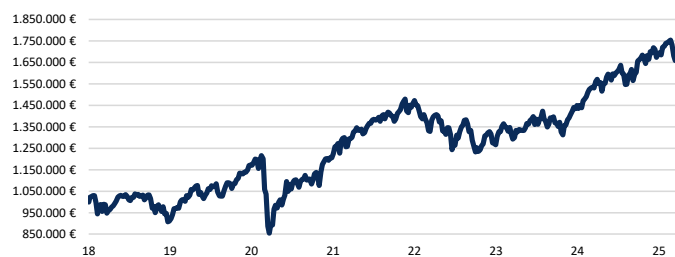
einer Investition von 1.000.000 Euro am 01.01.2018