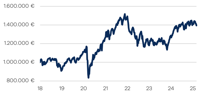
einer Investition von 1.000.000 Euro am 01.01.2018