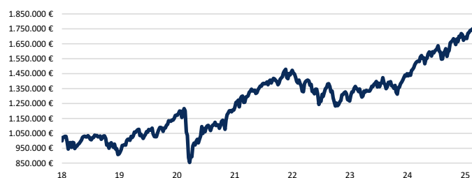
einer Investition von 1.000.000 Euro am 01.01.2018