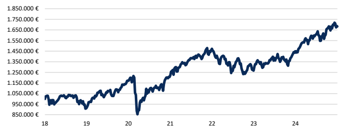
einer Investition von 1.000.000 Euro am 01.01.2018