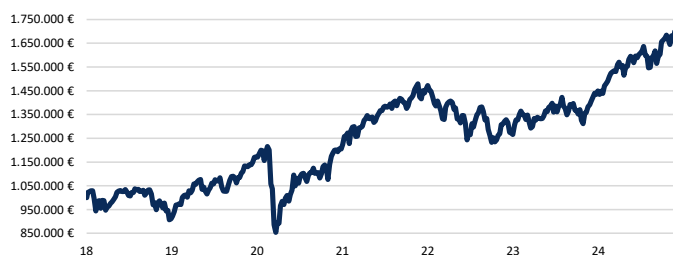
einer Investition von 1.000.000 Euro am 01.01.2018