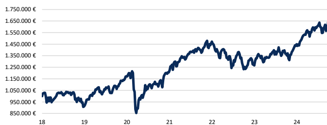
einer Investition von 1.000.000 Euro am 01.01.2018