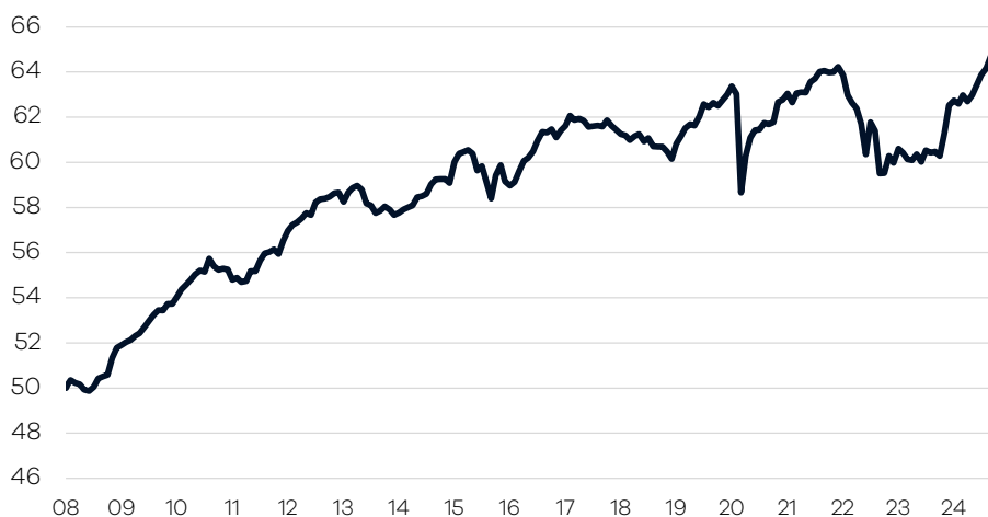
Bruttowertentwicklung 1 seit Auflage

— Ellwanger.Geiger Anleihen einschl. Ausschüttungen