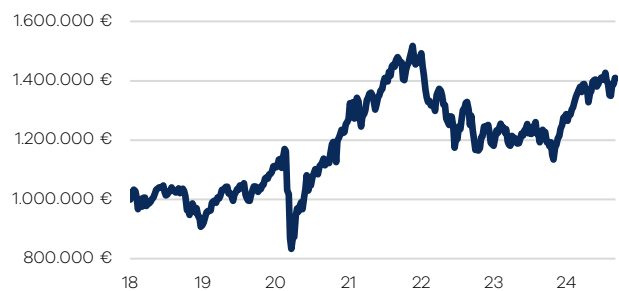
einer Investition von 1.000.000 Euro am 01.01.2018