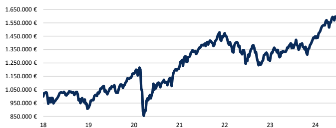
einer Investition von 1.000.000 Euro am 01.01.2018