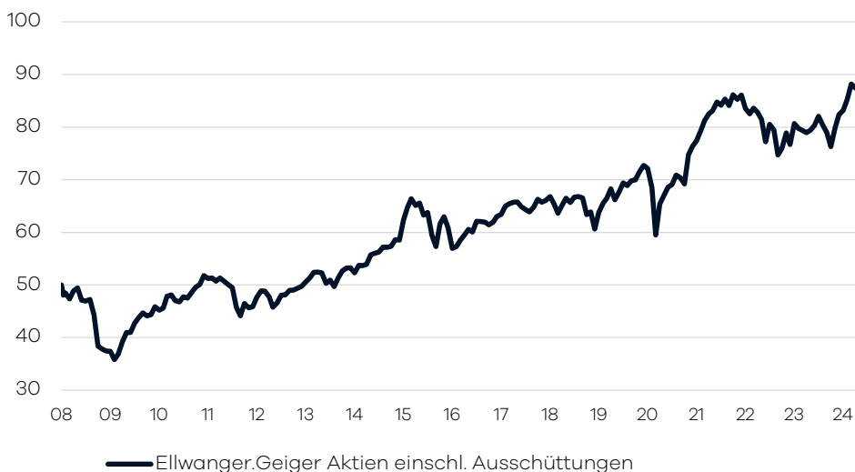
Bruttowertentwicklung 1 seit Auflage

— Ellwanger.Geiger Aktien einschl. Ausschüttungen