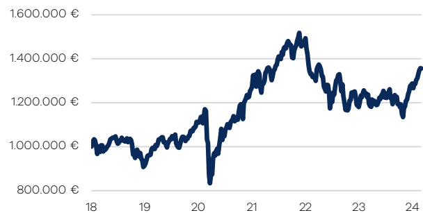
einer Investition von 1.000.000 Euro am 01.01.2018