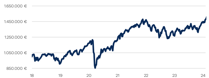
einer Investition von 1.000.000 Euro am 01.01.2018