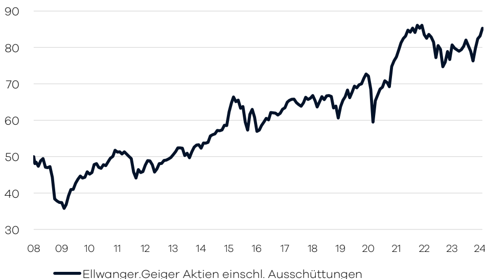
Bruttowertentwicklung 1 seit Auflage

Die internationale Aufteilung im Fonds wird durch die volkswirtschaftliche Analyse der Bankhaus Ellwanger & Geiger AG festgelegt. Passiv gemanagte Fonds (ETFs) über verschiedene Indizes hinweg bilden das Grundgerüst der Portfolio-Allokation. Ergänzend wird in aktiv gemanagte Aktienfonds investiert, welche bestimmte Länder/Regionen oder Themen/Branchen abdecken. Die Auswahl dieser Drittfonds erfolgt auf Basis eines unabhängigen, quantitativen und qualitativen Screenings. Der Fonds eignet sich für Aktienanleger mit einem langfristigen Anlagehorizont von mindestens 10 Jahren.