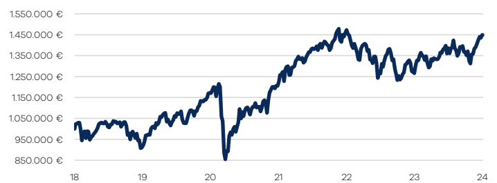
einer Investition von 1.000.000 Euro am 01.01.2018