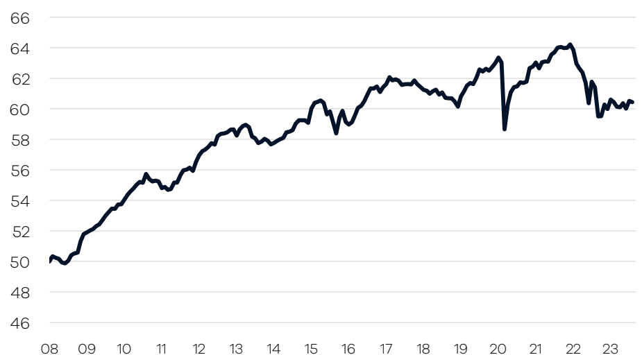
Bruttowertentwicklung 1 seit Auflage

— Ellwanger.Geiger Anleihen einschl. Ausschüttungen