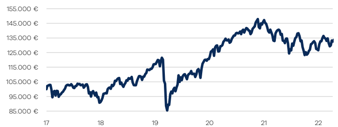
einer Investition von 100.000 Euro am 01.01.2018