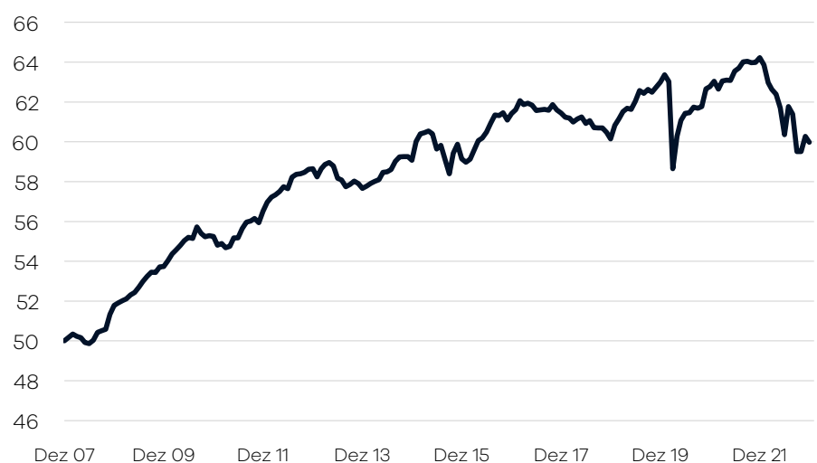
Bruttowertentwicklung 1 seit Auflage

— Ellwanger.Geiger Anleihen einschl. Ausschüttungen