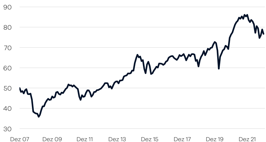
Bruttowertentwicklung 1 seit Auflage

— Ellwanger.Geiger Aktien einschl. Ausschüttungen