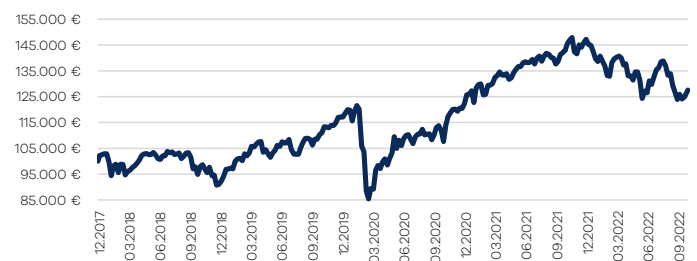
einer Investition von 100.000 Euro am 01.01.2018