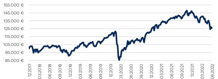
einer Investition von 100.000 Euro am 01.01.2018