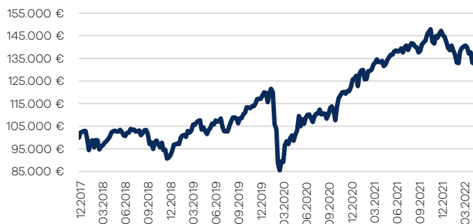
einer Investition von 100.000 Euro am 01.01.2018