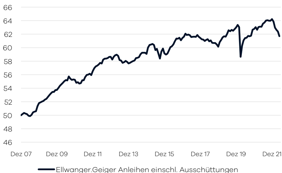
Bruttowertentwicklung 1 seit Auflage

der europaischen Kernlander einen Schwerpunkt. Bei der Auswahl der Unternehmensanleihen legen wir groen Wert auf gute Bonitat der Emittenten. Zur Abdeckung der auereuropaischen Markte und Spezialthemen wird vorwiegend in Investmentfonds (aktiv und passiv gemanagte Fonds) investiert. Die Auswahl dieser Drittfonds erfolgt auf Basis eines unabhangigen, quantitativen und qualitativen Screenings. Durch die breite Diversifikation (Streuung) uber die verschiedenen Anlagemarkte und Laufzeiten hinweg wird das Risiko der Gesamtanlage gemindert. Unter Risiko verstehen wir, neben den allgemeinen Risiken und den speziellen Risiken von Anlagen in Fonds und Anleihen, auch die Haufigkeit und Intensitat der Preisschwankungen im Wert des Fonds (Volatilitat).