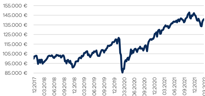
einer Investition von 100.000 Euro am 01.01.2018