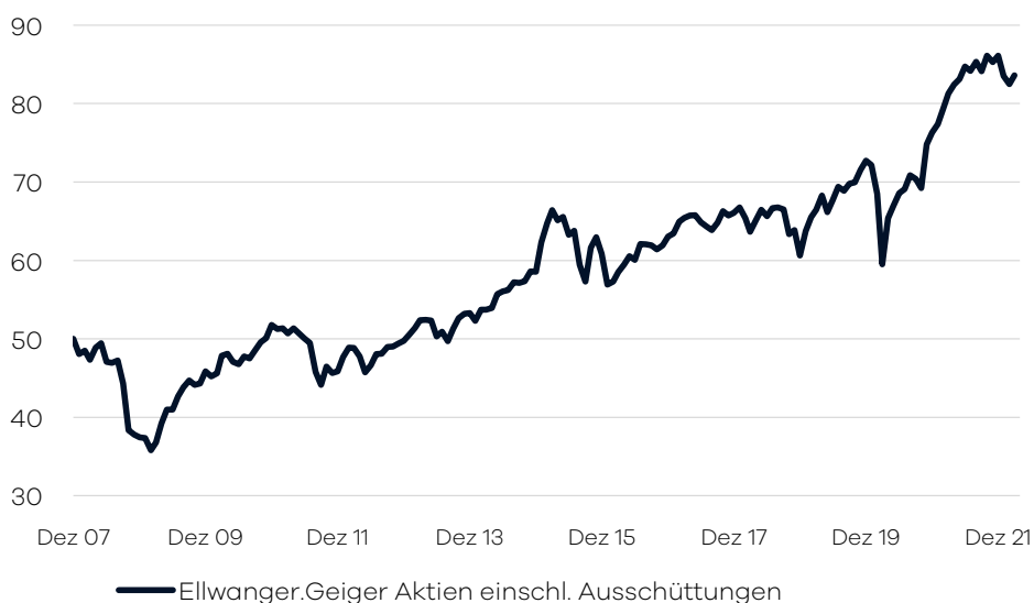
Bruttowertentwicklung 1 seit Auflage

Die internationale Aufteilung im Fonds wird durch die volkswirtschaftliche Analyse der Bankhaus Ellwanger & Geiger AG festgelegt. Passiv gemanagte Fonds (ETFs) über verschiedene Indizes hinweg bilden das Grundgerüst der Portfolio-Allokation. Ergänzend wird in aktiv gemanagte Aktienfonds investiert, welche bestimmte Länder/Regionen oder Themen/Branchen abdecken. Die Auswahl dieser Drittfonds erfolgt auf Basis eines unabhängigen, quantitativen und qualitativen Screenings. Der Fonds eignet sich für Aktienanleger mit einem langfristigen Anlagehorizont von mindestens 10 Jahren.